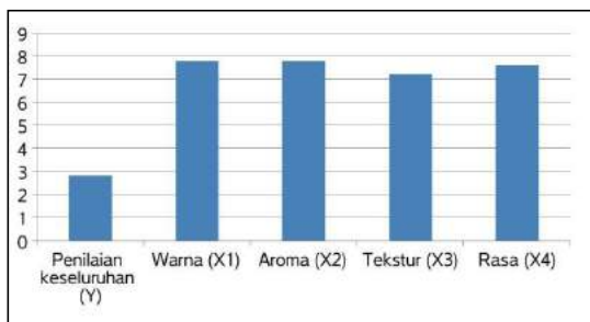
Gambar 2. Hasil Uji Organoleptik Pengasapan dengan Bahan Bakar Tempurung Kelapa dan Pemberian Garam 35%

Demikian pula hasil penelitian yang dilakukan oleh Swastawati (2008) yang melakukan penelitian terhadap ikan manyung asap, yang diolah menggunakan metode pengasapan yang berbeda, tidak memberikan perbedaan yang nyata terhadap nilai organoleptik. Ini dapat diindikasikan bahwa kedua perlakuan tersebut dapat diterima oleh panelis berdasarkan nilai organoleptik dari ikan manyung asap.