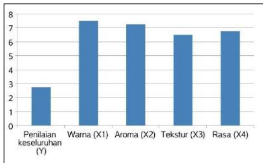
Gambar 1. Uji Organoleptik Pengasapan dengan bahan bakar Tempurung Kelapa dan Pemberian Garam 20%

Senyawa fenol dan karbonil berperan untuk memberikan rasa pada ikan asap (Martinez et al. , 2007). Senyawa volatil spesifik khususnya senyawa fenolik yang dikombinasikan dengan teknik pengasapan yang berbeda, secara langsung mempengaruhi karakteristik sensoris ikan asap (Cardinal et al. , 2006). Beberapa senyawa fenolik seperti guaiakol dan siringol merupakan senyawa yang sangat khas pada ikan asap (Jónsdóttir et al. , 2008).